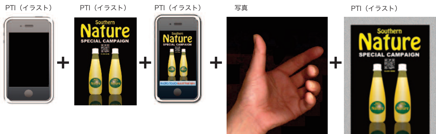
PTI (イラスト) と手 (写真) の合成

メタル素材などの質感やプラスチックやガラスなどの質感や透明感のイメージでは、写真よりも見やすく表現できるうえスピーディーでカンタンに販促ツールが作成できます。