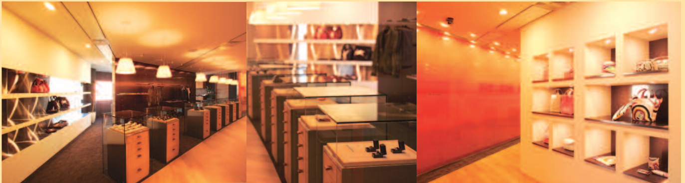
アクセスジャパン本社ショールーム