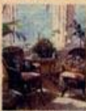
自由な感性で学ぶ 英国風フラワー アレンジメント

自由な感性で学ぶ 英国風フラワー アレンジメント 英国風フラワーアレンジメントは、自由な感性で学ぶことが大切です。英国風フラワーアレンジメントは、自由な感性で学ぶことが大切です。英国風フラワーアレンジメントは、自由な感性で学ぶことが大切です。