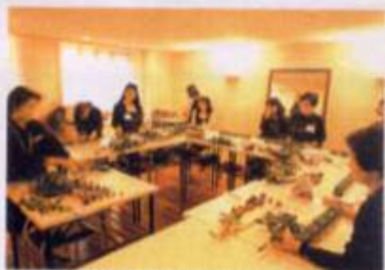
教室の様子。グループでも作業しやすいように開放式です。