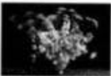
「花は、人間の心象を映し出す。その心象を、言葉で表現する。それが、いけばなである。」