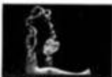
「花は、人間の心象を映し出す。その心象を、言葉で表現する。それが、いけばなである。」