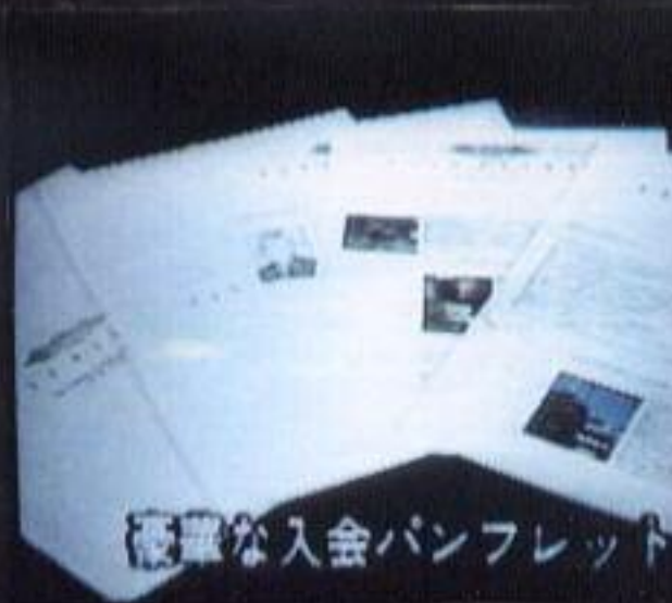
簡単な入会パンフレット