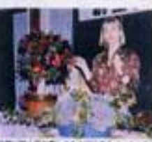
結婚式の準備から披露宴の進行まで、最新のトレンドを学ぶ。

本校は結婚式の準備から披露宴の進行まで、最新のトレンドを学び、実践できる。入学料は10万円、授業料は10万円。問い合わせは、03-3433-1111。