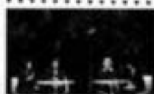
「花は、人間の心象を映し出す。その心象を、言葉で表現する。それが、いけばなである。」